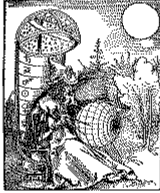
Αστρολογία, τὸ νόθο τέκνο τῆς Αστρονομίας. (Ευλογογραφία τοῦ Α. Durher, 1504).

Μὲ βάση τὰ προηγούμενα, μπορούμε νὰ ὑποστηρίξουμε ὅτι ἡ ἀστρονομικὴ γνώση τῶν Βαβυλωνίων, ὅπως καὶ ἡ πρόβλεψη διαφόρων οὐράνιων φαινομένων, ὑπῆρξε ἐπιστημονικὴ, τουλάχιστον ὅσον ἀφορᾷ στοὺς ἀστρονόμους - ἱερεῖς. Αὐτὸ σημαίνει ὅτι κανένας Βαβυλώνιος ἀστρονόμος - ἱερέας, δὲν πίστευε ὅτι οἱ θεοὶ μπορούσαν, κατὰ τὸ δοκοῦν, χωρὶς συγκεκριμένη γενικότερη φυσικὴ αἰτία, νὰ ὀδηγοῦν τὰ φυσικὰ φαινόμενα, ἔξω ἀπὸ τοὺς γενικοὺς συμπαντικοὺς φυσικοὺς νόμους. Γιὰ τοὺς Βαβυλώνιους, ἔργο τῶν θεῶν ἦταν ἡ συγκρότηση τῶν γενικῶν, ἀρχικῶν, συμπαντικῶν νόμων, μέσα στὰ πλαίσια τῶν ὁποίων ὀφείλαν νὰ λειτουργοῦν καὶ αὐτοί, σὲ κάθε περίπτωση ὑλικῆς ἐκφράσής τους.