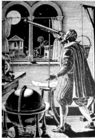
Γαλιλαῖος, ὁ πρῶτος ποὺ παρατήρησε τὸν οὐρανὸ μὲ τηλεσκόπιο.

Τὴν ταύτιση τῆς Ῥωμαιοκαθολικῆς Ἐκκλησίας μὲ τὴν Ἀστρολογία μπορούμε νὰ διαπιστώσουμε ἐκτὸς τῶν ἄλλων, ἀπὸ τὴν παρουσία ἀστρολογικῶν παραστάσεων καὶ συμβόλων σὲ πάρα πολλοὺς παλαιοὺς καθολικοὺς ναοὺς. Σὰν παράδειγμα ἀναφέρουμε τὸ ναὸ τῆς Σὰντρ στὴν Γαλλία, τὴν ἐκκλησία τῆς Γκροπίνια, τὸ Ἀββαεῖο Βεζέλεϋ στὴ Γαλλία, τὸ Βαπτιστήριο τῆς Πάρμα καὶ τὴ μητρόπολη τῆς Ἀμιένης στὴ Γαλλία.