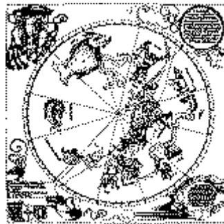
Άστερισμοὶ τοῦ νότιου ἡμισφαιρίου τοῦ οὐρανοῦ. Ἀπὸ ξυλογραφία τοῦ A. Durher (1515). Rosenwald Collection, National Gallery of Art, Washington DC

Γιὰ τὴν ἱστορία ἀναφέρουμε ὅτι σύμφωνα μὲ τὸν ἀποκρυφισμό, ὁ ὁποῖος πλέον ἔχει συνδεθεῖ στενὰ μὲ τὴν Ἀστρολογία, ὅλη ἡ δημιουργία ἀποτελεῖται ἀπὸ 13 διαστάσεις. Οἱ ἕξι ἐξωτερικὲς εἶναι ὑλικὲς καὶ κυβερνῶνται ἀπὸ τὸν Διάβολο - Μπελιάλ, τὸν ἐκπεπτωκότα ἀρχάγγελο Ἰλώτα(;). Στὴν 7η διάσταση ἀρχίζει νὰ ἐκδηλώνεται ἡ ψυχὴ. Στὶς ὁ ἐσωτερικὲς διαστάσεις κυριαρχεῖ ἡ ἱεραρχία τῶν λευκῶν ἀρχαγγέλων, μὲ ἐπικεφαλῆς τὸν ἀρχάγγελο Μιχαήλ.