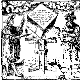
Αστρονομία και Αστρολογία. Μιά διένεξη αιώνων.

Η θεοσοφική αὐτή άποψη με τήν όνομασία «Έσωτερική Αστρολογία» άποτελεϊ τὸ βασικό θεωρητικό και φιλοσοφικό υπόβαθρο τής έφηρμοσμένης Αστρολογίας ή όποία όνομάζεται «έξωτερική Αστρολογία» ή «Άστρολογία πρόβλεψης».