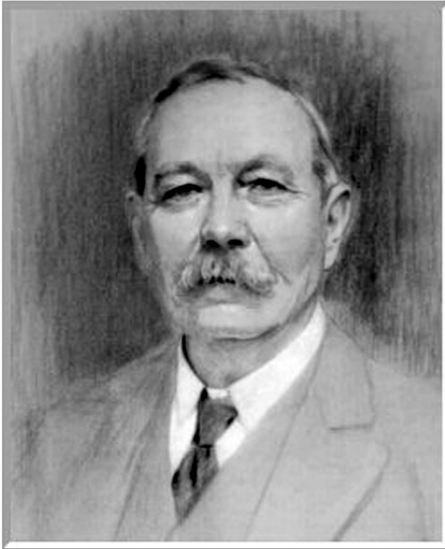
Sir Arthur Conan Doyle 1859-1930

παραμένουσα πλησίον αὐτοῦ, συνώδευσε ταύτην εἰς τὴν οἰκίαν τῆς. Ἀλλὰ μετὰ τινὰ λεπτὰ τῆς ὥρας ἀπὸ τῆς ἐκεῖ ἀφίξεώς των καὶ ἐνῶ ἐκάθηντο ἐν δωματίῳ εἰς τὸ ὁποῖον εὗρίσκετο κιθάρα ἀνηρτημένη ἐπὶ τοῦ τοίχου, αἴφνης ἄνευ οὐδεμιᾶς ὁρατῆς ἐνεργείας ἠκούσθη ἰσχυρὸς ἦχος παραχθεις ἐκ συγχρόνου πλήξεως ὄλων τῶν χορδῶν τῆς κιθάρας, αἱ ὁποῖαι καὶ ἔσπασαν, γεγονός ὅπερ κατετάραξε μεγάλως αὐτούς. Παρατήρησαν οὗτοι τὸ ὠρολόγιόν των ἐξηκριβώθη δὲ βραδύτερον ὅτι ἡ ὥρα τοῦ ἤχου συνέπιπτε πρὸς τὴν ὥραν τοῦ θανάτου. Σημειωτέον δὲ ὅτι ὁ ἀποβιώσας ὢν μουσικόφιλος συχνὰ μετεχειρίζετο τὴν κιθάραν...».