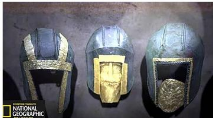
Χρυσές μάσκες Μακεδόνων πολεμιστών του Αρχοντικού Πέλλας

Συγκεκριμένα, το National Geographic, φιλοξενεί στο ίδιο το διεθνούς αίγλης Μουσείο του, στην Ουάσινγκτον, την πρωτόγνωρη Έκθεση με τον αποστομωτικό τίτλο : "ΟΙ ΕΛΛΗΝΕΣ, από τον Αγαμέμνονα στον Μέγα Αλέξανδρο"! Η Έκθεση, με τον αποστομωτικό για τους πλαστογράφους τίτλο και τους κάθε είδους υποστηρικτές τους, άνοιξε την Τετάρτη 1η Ιουνίου και διήρκεσε ως τις 10 Οκτωβρίου 2016.