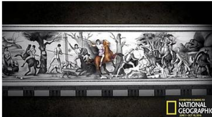
Ζωφόρος Τάφου Φιλίππου Β΄, με τονισμένο τον Μέγα Αλέξανδρο ΣΤΟ ΜΟΥΣΕΙΟ ΤΟΥ NATIONAL GEOGRAPHIC

Το αμερικανικό National Geographic πραγματοποιεί απίστευτη στροφή 180 μοιρών, καθώς από τους χάρτες που ανέγραφαν "Μακεδονία" τα Σκόπια στο παρελθόν, περνάει τώρα στην απόλυτη δικαίωση τού Ελληνισμού και στην πιο ανέλπιστη παγκόσμια προβολή τής ελληνικότητας τής Μακεδονίας, του Φιλίππου και του Μεγάλου Αλεξάνδρου, μέσα στην ίδια την πρωτεύουσα τών ΗΠΑ, επηρεάζοντας έτσι την ελίτ τής Αμερικής, πολιτική, οικονομική, στρατιωτική, πολιτισμική ! Κάτι το οποίο αποτελεί χαστούκι θανάτου στα Σκόπια !