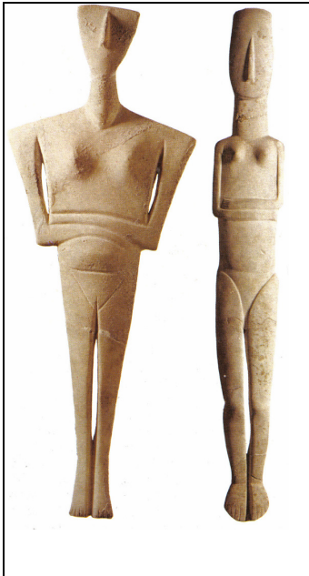
Εικόνα 1.2: Ειδώλια της Μεγάλης Μητέρας

«Μητέρων», των χθόνιων θεοτήτων. Παράδειγμα αποτελούν οι γυναικείες μορφές της ελληνικής θρησκείας όπως, η Νέμεσις, οι Ερινύες, η Θέμιδα, στις οποίες αναγνωρίζονται τα πρωταρχικά χαρακτηριστικά της Μητέρας-Γης. Είναι γεγονός ότι η Γη ή Γαία αντικαταστάθηκε τελικά από τη Δήμητρα, αλλά η επίγνωση της εξάρτησης μεταξύ της θεάς των σπόρων και της Μητέρας-Γης χάθηκε στους Έλληνες 13 . Η Γαία μετέδωσε στους νέους θεούς το μυστικό της νίκης και με τη συνδρομή της οι Ολύμπιοι θεοί κέρδισαν τους Τιτάνες.