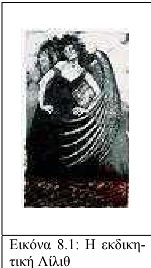
Εικόνα 8.1: Η εκδικητική Λίλιθ

Ο πρώτος μύθος αναφορικά στο πρόσωπο της προέρχεται από την αρχαία περιοχή της Σουμερίας. Οι ρίζες εξαπλώθηκαν ιδιαίτερα, όμως η ίδια η Λίλιθ δε συναντάται πέρα από το πάνθεον των θεοτήτων και των δαιμόνων. Στη Σουμερία ο όρος «Λιλ» σημαίνει «Αέρας». Σε πολλές αρχαίες κουλτούρες η ίδια λέξη επίσης ήταν ταυτόσημη με τον όρο «Πνεύμα». Επίσης στη Σουμερία-Βαβυλώνα η Λίλιθ ήταν γνωστή ως Lilith-Ardat, όπου το Ardat περιέγραφε μια νεαρή γυναίκα σε ηλικία γάμου. Έτσι η Λίλιθ ήταν ένα νεαρό, θηλυκό πνεύμα, που οι δαίμονες το κληροδότησαν με το σύνδρομο της «εσπερινής Στρίγγλας». Είναι επίσης ενδιαφέρον ότι η Σουμερική λέξη για τη «φαυλότητα» ήταν Lulu, ενώ η λέξη για την «τρυφηλότητα» ήταν Lulu και αυτή για το «δαιμονικό» ήταν Limnu. Έτερος μύθος ήταν αυτός που αφορούσε σε ένα θηλυκό δαίμονα, ο οποίος είχε στοιχειώσει το δέντρο της ζωής της θεάς Ινάννα, ο οποίος ήταν η Λίλιθ 13 .