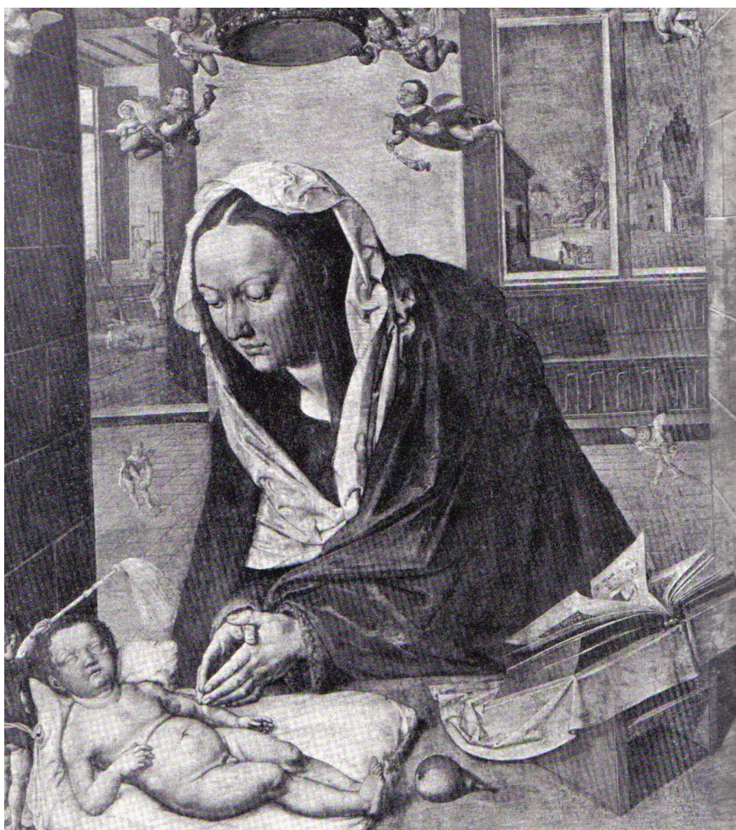
Εικόνα 6.3: Η προσκύνηση του Θείου βρέφους