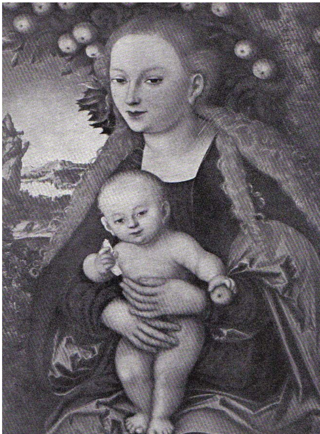
Εικόνα 6.4: Η Θεοτόκος υπό μηλέαν, με το Χριστό φέροντα μήλον και άρτον