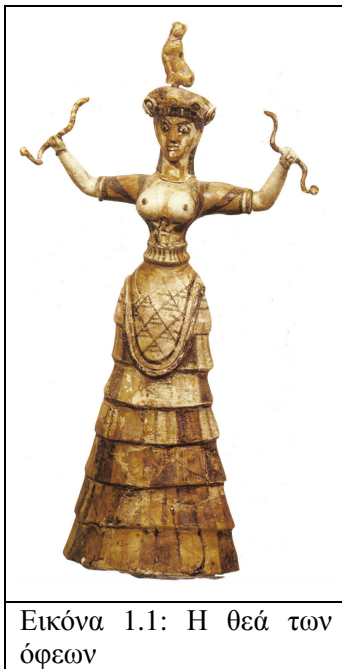
Εικόνα 1.1: Η θεά των όψεων

Η λατρεία της Μεγάλης Μητέρας είναι σε κάποιο βαθμό περίπλοκη, αφού στην περίπτωση της η αυτόχθον, Μινωική-Μυκηναϊκή παράδοση διασταυρώνεται με απευθείας αποδοχή στοιχείων από το Φρυγικό Βασίλειο της Μικράς Ασίας 9 . Στην Κρητο-μυκηναϊκή θρησκεία η Γη ήταν η Μητέρα όλων, με εικόνα που την απέδιδε ως μία γυναίκα με τα πόδια κρυμμένα στη γη. Η λατρεία της ήταν σπάνια, ενώ η ίδια ήταν περισσότερο μία ιδέα της φύσης, παρά μία θεότητα 10 .