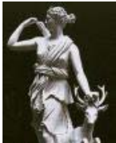
Εικόνα 2.5: Άρτεμις

Άρτεμις, άρτιος + τέμις. Ήταν αρτίως τέμνουσα, θεά του κόσμου της ζωής, δηλαδή που κατανέμει τα είδη και τα επίπεδα του κόσμου μέσα στον οποίο ζουν, αποδίδοντας στα έμβια όντα τα ένστικτα 34 .