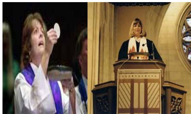
Εικόνα 6.5: Γυναίκες ιερείς

1992. Η εκκλησία της Αγγλίας εγκρίνει τη χειροτονία γυναικών στις 11 Νοεμβρίου 151 .