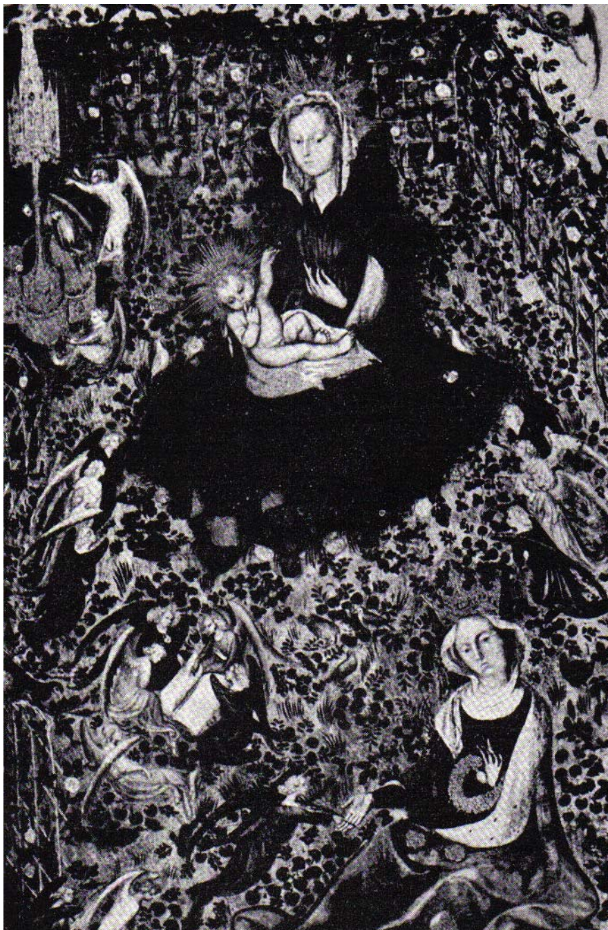
Εικόνα 6.2: Η Παναγία του Ροζαρίου (Μουσείο Castelrecchion)