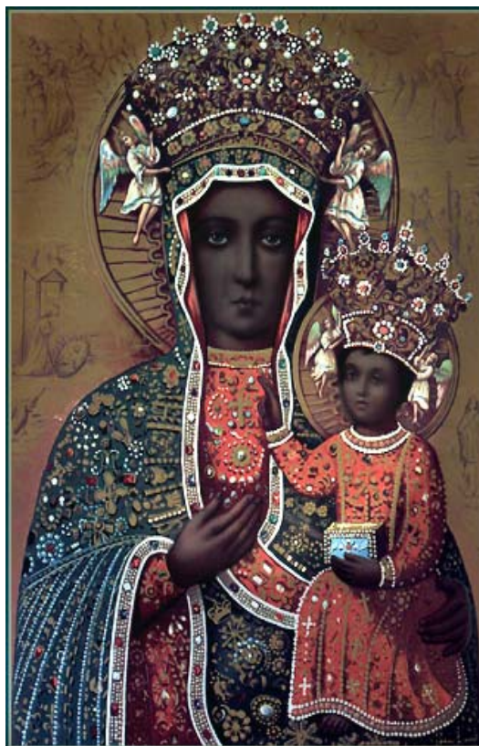
Εικόνα 6.5: Η Μαύρη Παναγία (Black Madonna)