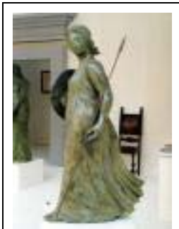
Εικόνα 2.3: Αθηνά

Οι δύο πρώτοι αιώνες της αρχαϊκής εποχής (7 ος και 6 ος π.Χ. αιώνας) και η τότε