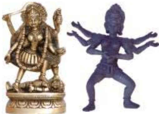
Εικόνα 4.3: Η θεά Κάλι

Η Λάχσμι αναφέρεται επίσης ως η «Μητέρα Θεά» του σύμπαντος, και είναι η θηλυκή δύναμη του υπέρτατου πνεύματος. Μαζί με τη Σάκτι-Παρβάτι και τη Σαρασβάτι, δημιουργείται η θηλυκή έκφραση της Θεϊκής Τριάδας. Στο πλάι του Βίσνου, η Λάχσμι ενσαρκώνεται κάθε φορά που ενσαρκώνεται και εκείνος, όντας πάντα στο πλευρό του 26 .