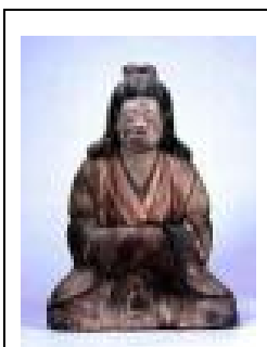
Εικόνα 4.1. Η θεά Ιζανάμι

Τέσσερις χιλιάδες διακόσια είκοσι τρία νησιά συνθέτουν την Ιαπωνία, από τα οποία μόνο εξακόσια κατοικούνται, και μόλις πέντε είναι μεγάλα, με πρώτο απ' όλα το νησί Χονσού. Η μυθολογία βεβαιώνει ότι το ιαπωνικό αρχιπέλαγος γεννήθηκε από τις ισάριθμες σταγόνες που σκόρπισε στη θάλασσα το θεϊκό δόρυ του αδερφικού και ταυτόχρονα συζυγικού ζεύγους Ιζανάγκι-Ιζανάμι. Η θεά Ιζανάμι (εικόνα 4.1) ήταν η Μητέρα Γη, ενώ αργότερα έγινε θεά του θανάτου. Στην ιαπωνική μυθολογία, τον καθοριστικότερο ρόλο διαδραμάτισε η Αματεράσου Ομικάμι, ή Αμά-Τεράζου, θεά του ήλιου, του φωτός και του ουρανού. Αυτό σημαίνει, όπως και σ' όλες τις μυθολογίες αρχαίων λαών όπου κυριαρχούν οι θεές, ότι η αρχική κοινωνική συγκρότηση της Ιαπωνίας ήταν μητριαρχική 1 .