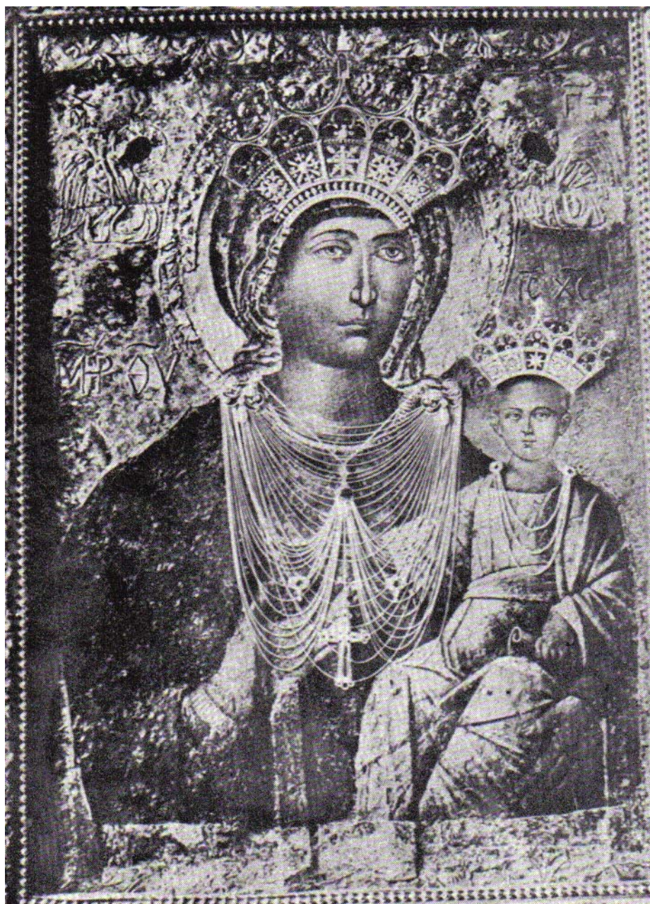
Εικόνα 6.1: Παναγία η Μεσοπαντήτισσα