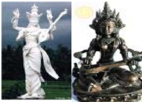
Εικόνα 4.2: Η Σαρασβατή

Η εμφάνισή της είναι συνήθως λιτή (για τα Ινδικά δεδομένα), χωρίς πολλά κοσμήματα, θέλοντας έτσι να τονιστεί η αδιαφορία της για τα υλικά αγαθά και η προτίμησή της στον πνευματικό πλούτο.