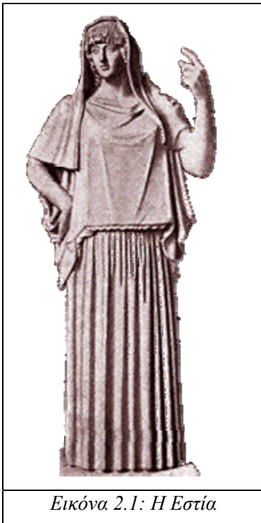
Εικόνα 2.1: Η Εστία

Πιθανότατα το όνομα Εστία να προέρχεται από το σανσκριτικό vas , που σημαίνει «κατοικώ», αλλά και «λάμπω». Κατά άλλη ερμηνεία, σημαίνει τη λάμπουσα φλόγα, που φωτίζει και θερμαίνει. Αργότερα το όνομα συμπεριέλαβε και τον λίθο πάνω στον οποίο έκαιγε το πυρ. Όπως κάθε οικία είχε την εστία της, έτσι και σε κάθε πόλη υπήρχε η κοινή εστία, από την οποία παραλάμβαναν το ιερό πυρ σε εξαιρετικές περιπτώσεις: πολεμικές επιχειρήσεις, αποίκιση νέων τόπων. Γι' αυτό στον Ορφικό ύμνο της λέγεται ότι είναι εκείνη «η οποία κατέχει τον μέσον οίκον του αιωνίου και μεγίστου πυρός» 2 .