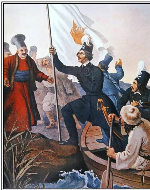
Ο Αλέξανδρος Υψηλάντης διαβαίνει τον Προύθο, πίνακας του Peter von Hess. Στα καπέλα τους διακρίνεται η νεκροκεφαλή με τα διασταυρούμενα οστά.

Τα σύμβολά του αρχίζοντας από το κρανία με τα διασταυρούμενα οστά που ως υπενθύμιση του memento mori συμβόλιζε την απόφαση των εθελοντών για ελευθερία ή θάνατο, ήταν όμως και έμβλημα ναίτικο και τεκτονικό που παραπέμπει σε μυστικές εταιρείες. Καλύτερα όμως το περιγράφει ο Γάλλος ευγενής Αύγουστος Ντε Λαγκάρντ ( Augustin de Lagarde ) , όταν στα απομνημονεύματα του για το συνέδριο της Βιέννης (Παρίσι 1843), αναφέρεται στην «Εταιρεία» του Ρήγα, και στη συνέχεια στην Φιλική Εταιρία και τον στρατό που προετοίμαζε ο Υψηλάντης : ... « ... Η στολή των μελών ήταν ολόμαυρη και συνοδεύετο από σκούφο, επί του οποίου απεικονίζονταν μια νεκροκεφαλή και υπ' αυτήν δύο οστά σταυροειδώς τοποθετημένα. Τα χρώματα της εταιρείας ήταν άσπρο-μαύρο- κόκκινο. Η εταιρεία αυτή έφθασε να αριθμεί 60.000 μέλη. Είχε τέσσαρες μυστικές τάξεις. Ένας πέπλος βαθύτατου μυστηρίου εκάλυπτε την φύσιν της, ...Εις των φλογερωτέρων υποστηρικτών της ήταν ο μητροπολίτης Ουγγρο-βλαχίας Ιγνάτιος.»